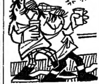
كاس الرياضة اللبنانية